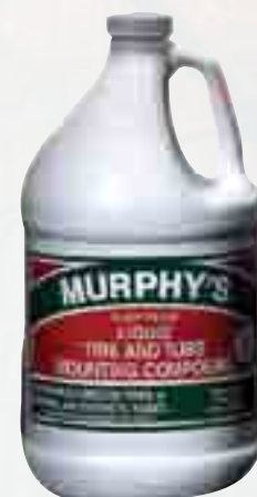
Composé liquide de fixation pour pneu et chambre 1950 3.78L