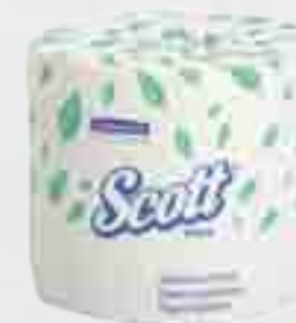
Papier hygiénique SCOTT® 48040 2-plis