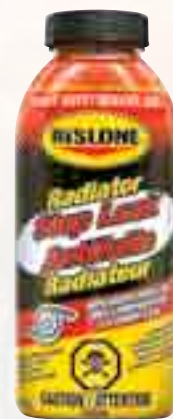
Antifuite radiateur Rislone 31191