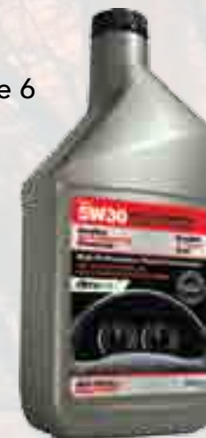
Huile Dexos 5W30 QSYNDEXOS-1X6 Caisse de 6