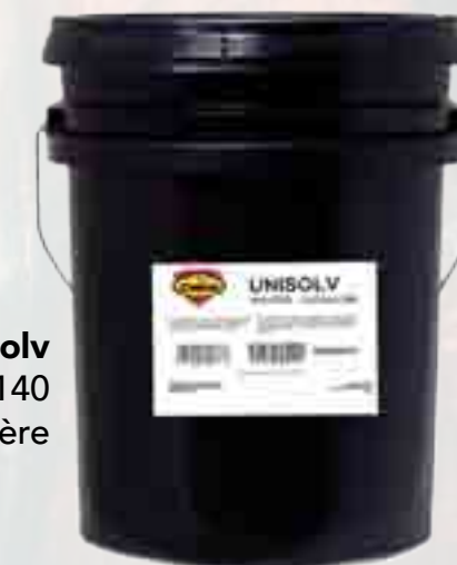
Cobra Unisolv FBB0009140 18.9L Chaudière