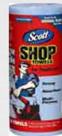
Chiffons d'atelier 75120