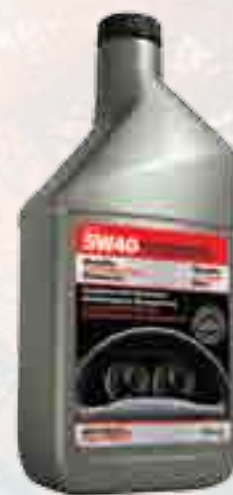
Huile QAP 5W40 QSYN5W40-1X6 Vendu en caisse de 6