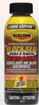
Scellant de bloc antifuite Rislone Liquid Copper™ 31109