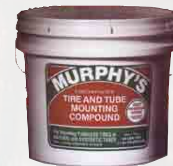
Composé de fixation pour pneu et chambre 2000 8lb Chaudière