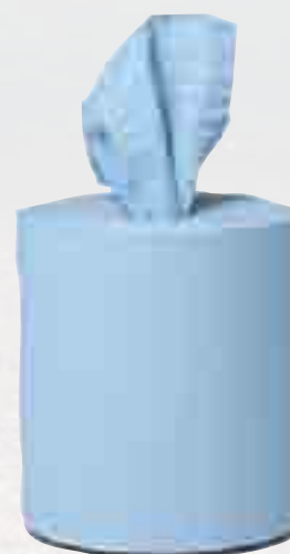
Chiffons d'atelier KREW® 400 33046