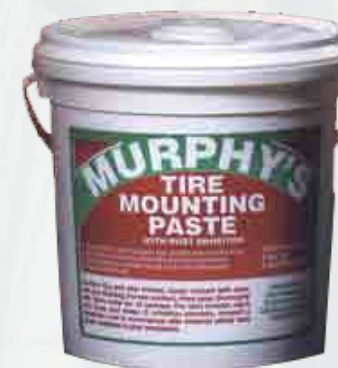
Euro Pâte pour montage de pneus 2146 8lb Chaudière