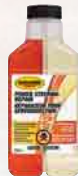
Réparateur pour servodirection Rislone 34650