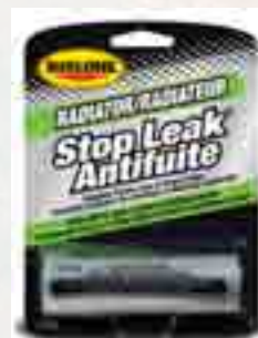
Radiateur antifuite 31170