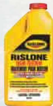
Traitement pour moteur Rislone 34100