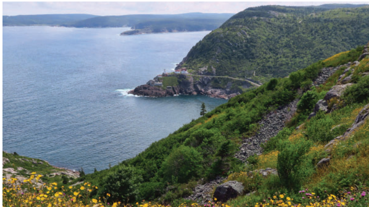
Ci-dessus: Vue de Signal Hill