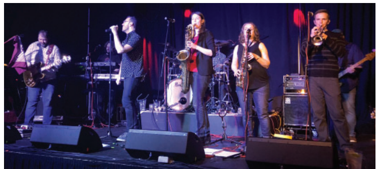
Groupe rock 709 de St. John!

L'équipe ProMax a remporté le défi du rallye, les participants ayant été jugés pour leur dynamique participation au chant, à la danse en ligne irlandaise et à un Screech-In de Terre-Neuve, qui comprenait le baiser traditionnel d'une morue. L'émblématique George Street et le Groupe rock 709 local a séduit notre groupe et l'on se souviendra affectueusement de lui. L'opinion de notre groupe envers l'hospitalité de St. John a reçu un... God love ya me ol' trout! Nous annoncerons notre prochain Buy & Sell 2019 à notre AGA d'avril. Restez à l'écoute!