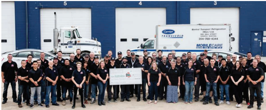
Sur la photo, la famille d'employés CTR au cours de la présentation du chèque

Félicitation à CENTRAL TRANSPORT REFRIGERATION (CTR) de Winnipeg, au Manitoba, pour la plus grande collecte de fonds jamais réalisée. Ils ont recueilli 15 000 $ pour la Fondation de l'hôpital pour enfants du Manitoba. Le CTR a généreusement égalé chaque dollar collecté par leurs clients et fournisseurs très appréciés. Bien joué!