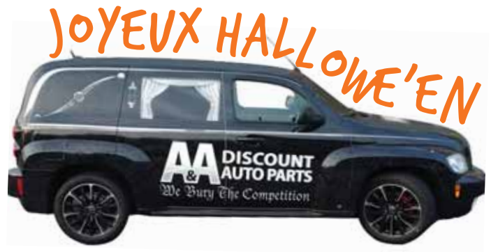
Joe Tarasca de Pièces d'auto A&A Discount a un nouvel ensemble de roues.