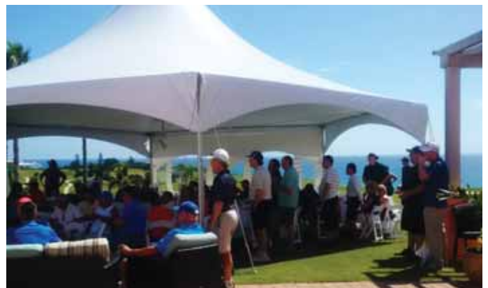
Photographies (deux photos): Club de golf Port Royal où les participants ont profité d'un lunch à l'abri du soleil.